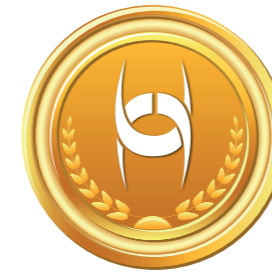
1. místo v kategorii Autopojištění