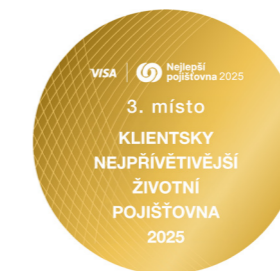
3. místo v kategorii Klientsky nejpřívětivější životní pojišťovna