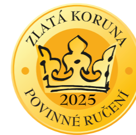
1. místo v podkategorii povinného ručení