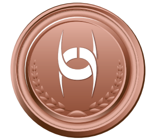
3. místo v kategorii Pojištění občanů