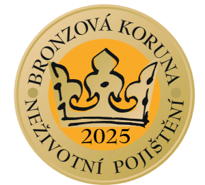
3. místo v kategorii neživotního pojištění pro produkt Autopojištění Combi Plus IV