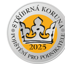
2. místo v kategorii pojištění podnikatelů